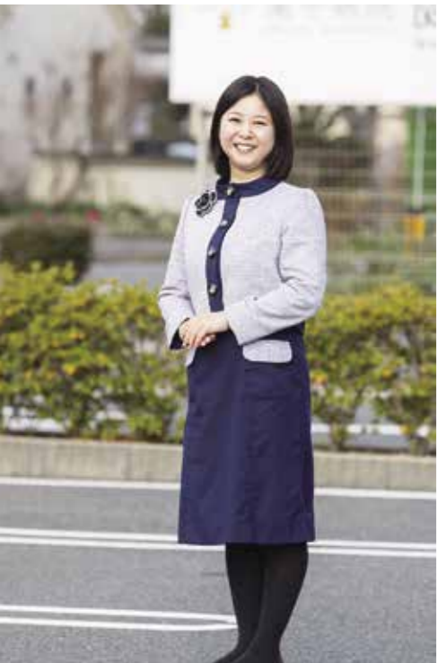
社会医療法人いち樹会 尾中病院