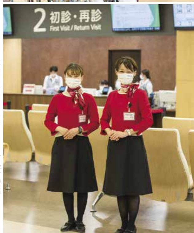
J A 岐阜厚生連 岐阜・西濃医療センター 西濃厚生病院