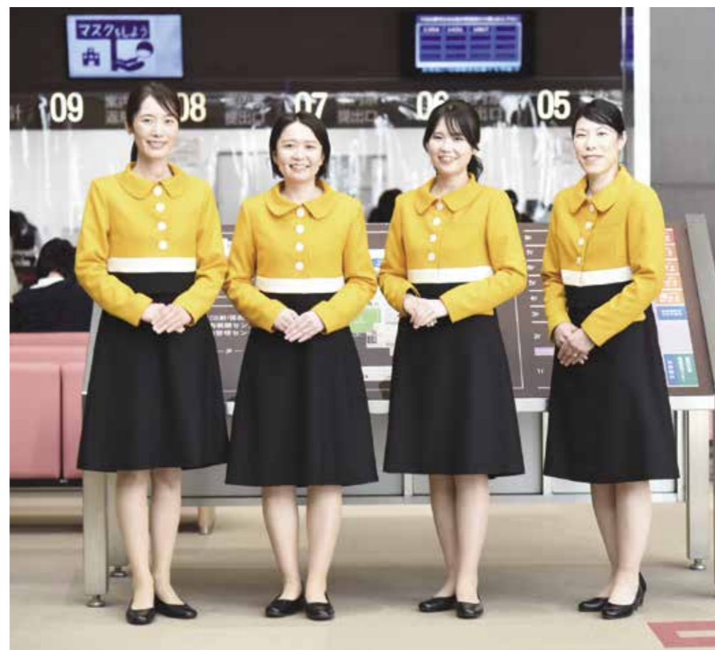
J A 愛知厚生連 江南厚生病院