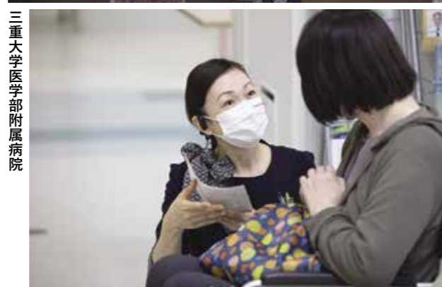
三重大学医学部附属病院