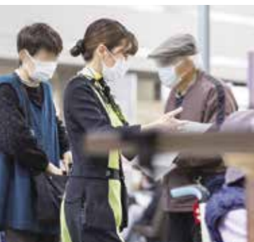
J A 三重厚生連 鈴鹿中央総合病院