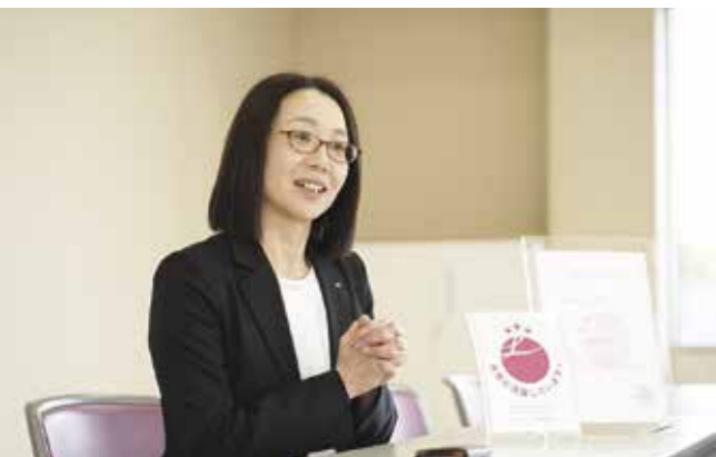
認定を受けて女性社員が取材を受けました。

えるぼしには3つの段階があり、5つの評価項目のうちクリアする項目数によって認定される段階が変わります。今回サマンサは、5つすべての基準を満たし、3段階目(3つ星)を取得しました。