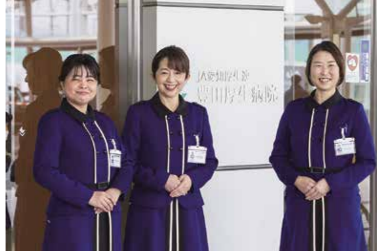
J A 愛知厚生連 豊田厚生病院