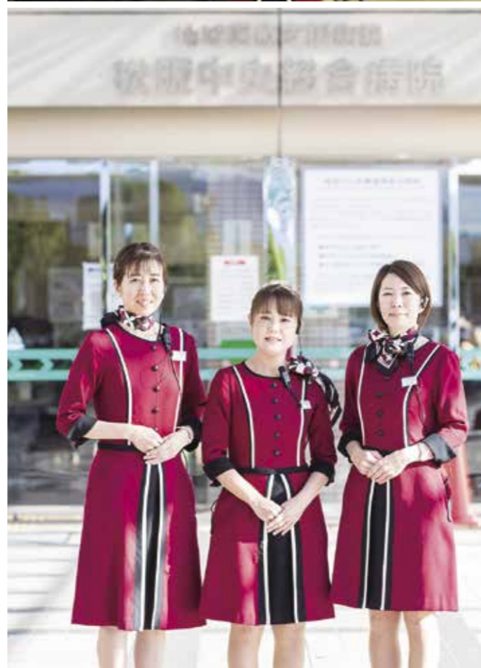
J A 三重厚生連 松阪中央総合病院