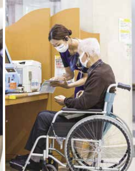
藤田医科大学病院