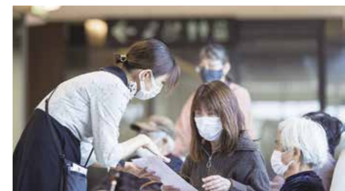
特定医療法人睡純会 武内病院