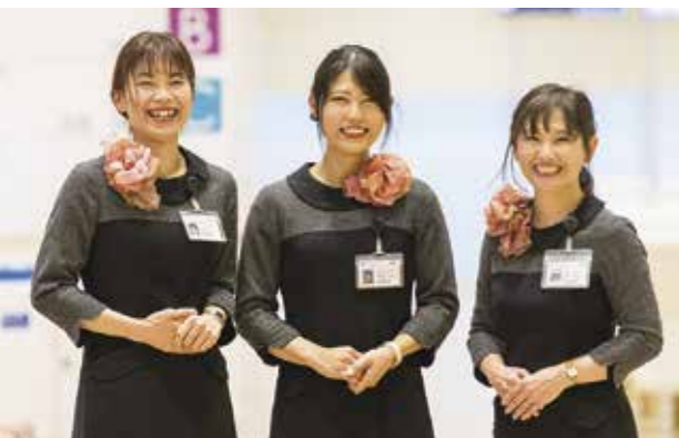
J A 愛知厚生連 海南病院