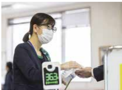
笑顔でご案内いたします