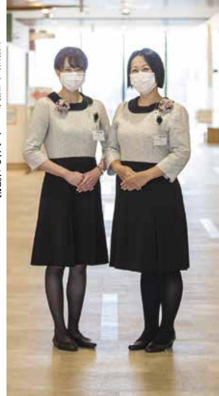
医療法人尚徳会 ヨナハ丘の上病院