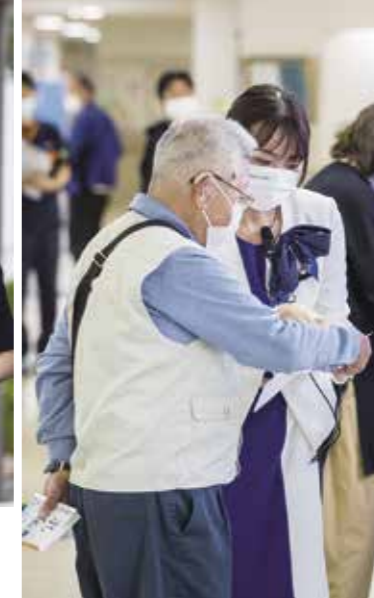
J A 岐阜厚生連 中濃厚生病院