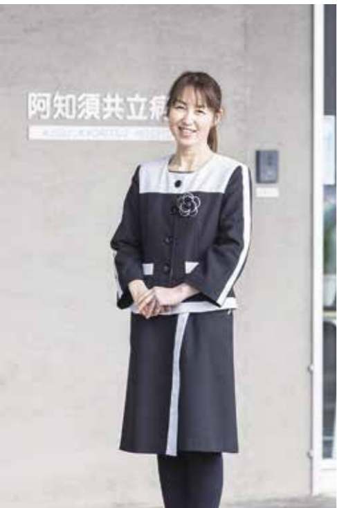
医療法人協愛会 阿知須共立病院