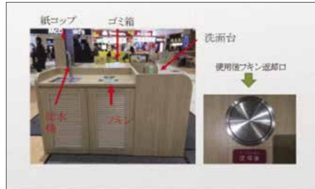
フキン設置型給水機

「ショートSQC(プチャットSQC)」 と呼ばれていた活動。 ショートではありますが、 これも立派な改善活動。