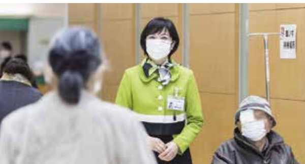
J A 愛知厚生連 安城厚生病院