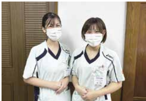
スタッフコメント ナースエイド

病棟を管理する師長からは看護 師にも余裕ができて、ベッドサイ ドで仕事ができるようになったと 報告を受けています。あとは、やは