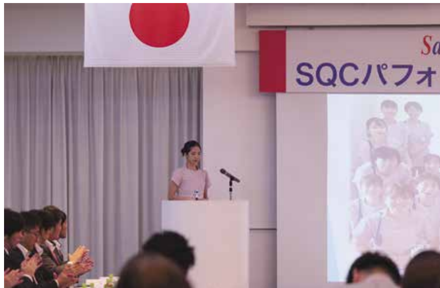
長野営業所 篠ノ井総合病院ナースエイド