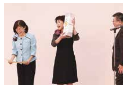
最優秀賞 鈴鹿営業所・春日井営業所・三河営業所