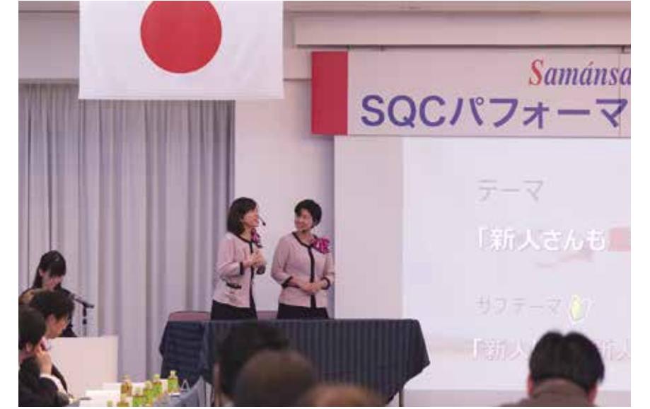
① 鈴鹿営業所・春日井営業所・三河営業所