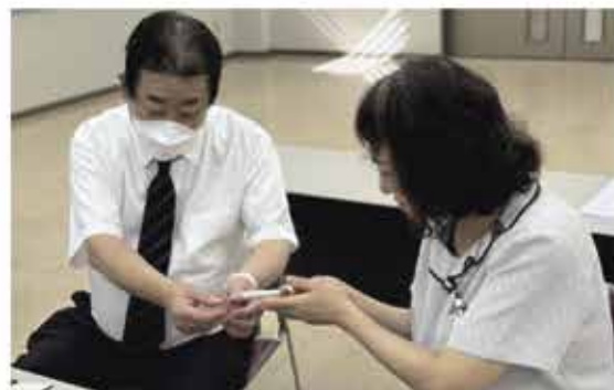
テクノサービス部「接客・ビジネスマナー研修」