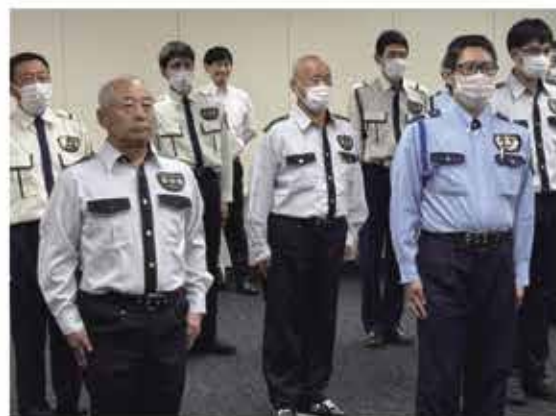
警備部「警備基本動作及び護身術研修」