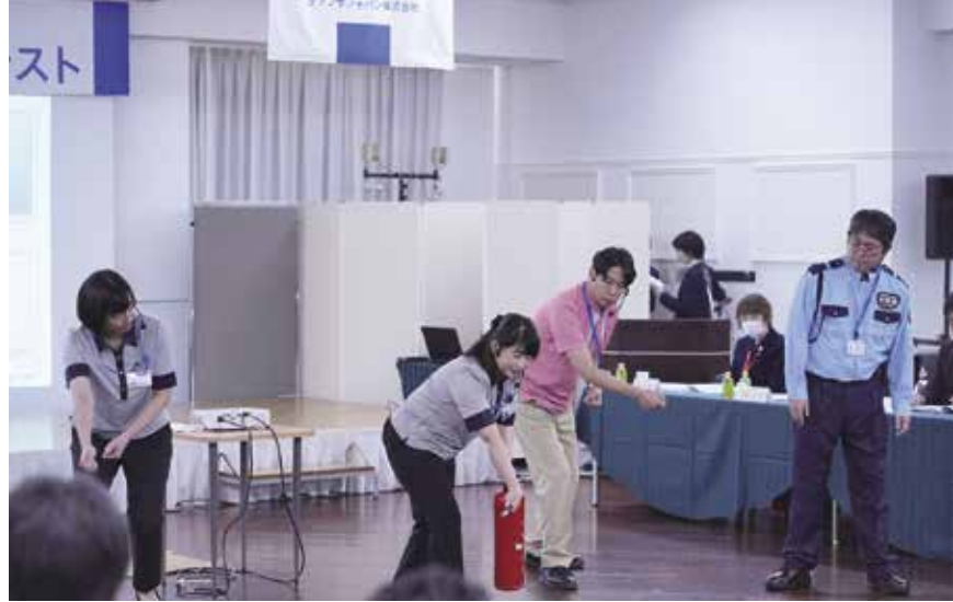
④ 神奈川営業所・長野営業所