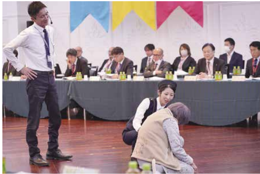
⑤ 岡山営業所・神戸営業所