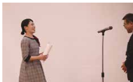
感動賞 岩国営業所・広島営業所・テクノサービス部・営業部

SQCパフォーマンスコンテストではお越しいただくお客様を「おもてなしの心」でお迎えしています。開催前日には本社社屋でお客様同士が交流できる意見交換会を開き、その後の食事会では瀬戸内海で育まれた「食」をお楽しみいただきました。当日の駐車場はサマンサ警備が安全を確保し、会場入口ではコンシェルジュがお客様をお迎えました。