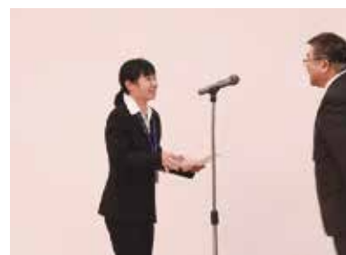
優秀賞 岡山営業所・神戸営業所